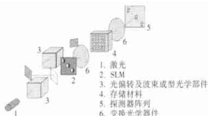
图2 全息存储系统组成

图2所示只是全息存储系统的部分组件。另外还有复杂的光学系统、访问其它存储体的机械运动部件、控制系统的电子设备和实现编解码处理的存储通道等。