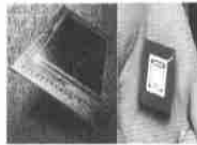
图 3 Photobit 公司生产的 APS

自从 70 年代贝尔实验室首次开发出 CCD 以来,影像公司不断地发展并改进这一技术。CCD 能提供好的图像质量,但是昂贵、功耗大,而且由于需要辅助芯片而使体积变大。认识到 CCD 的这些不足和人们对轻便成像系统的不断追求,特别是星际航天器应用的要求,NASA Jet Propulsion Laboratory (JPL) 开始研制第二代固态图像传感器技术。1992 年下半年制造出了互补金属氧化物半导体有源像素传感器(CMOS APS)。通过固化函数和更加有效地读取图像,APS 耗电量是 CCD 的 1%,体积比 CCD 减小 10%,并且加工方便、价格便宜,不易受辐射影响。虽然 APS 在信噪比、灵敏性、图像均匀性等方面还不能同最好的 CCD 相比,但 APS 却具有全息存储所要求的短存取时间和高速传率等特性,因而,对于研制小型、高速、实用的全息存储器,APS 是全息存储器中探测器阵列比较理想的选择。Photobit 公司生产的 APS 见图 3。